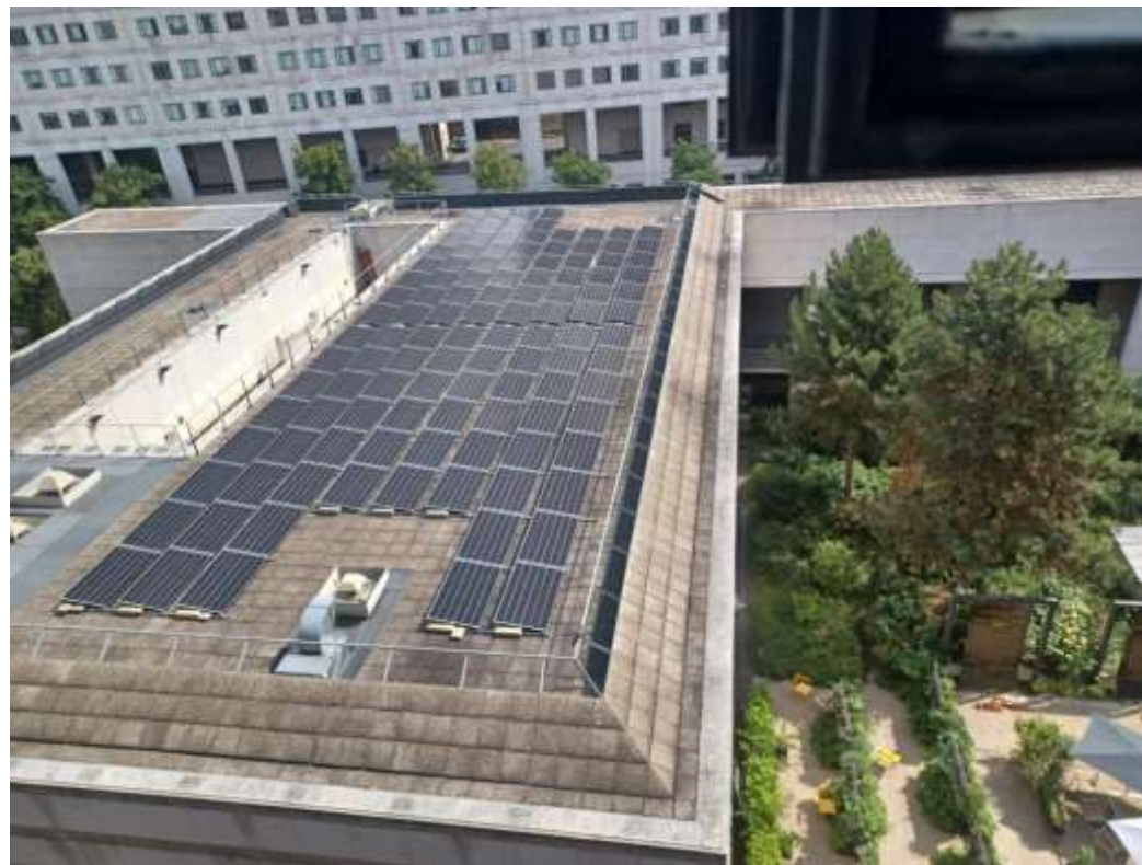
(Photo du 26/06/2023) un aperçu du ministère de l'économie, qui a des panneaux photovoltaïques.