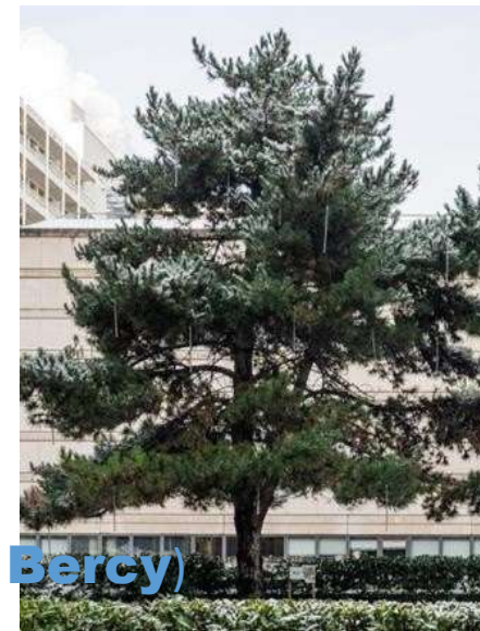
Allée Jean Monnet (allée principale du site de Bercy)